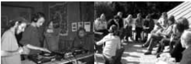
Projekt "Hudbou proti nudě a neinformovanosti" - výuka mixování elektro-nické hudby v Roudnici nad Labem

K termínu uzávěrky k podání žádostí o grant se sešlo celkem 18 projektů. Regionální hodnotící komise a následně komise v Praze rozhodla o podpoře nejlepších projektů. Bylo podpořeno celkem 10 projektů mladých lidí z celého Ústeckého kraje. Na projekty bylo rozděleno celkem 250.000,- Kč. (seznam a anotace podpořených projektů na www.dcul.cz ).