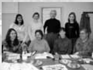
Pracovní setkání dobrovolnického týmu