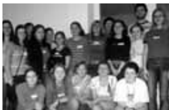
výcvik v DD Severní Terasa

Tato činnost je přitažlivá pro ty, kteří mají zájem o přátelský vztah se seniory. Obyvatelé zařízení hledají osobního společníka pro volný čas, či doprovod na procházky. Dobrovolníci nabízejí mnoho dovedností. Mezi dobrovolníky byli lidé různého věku a profese. Studenti středních a vysokých škol získali nové zkušenosti v komunikaci se seniory. Každý z nich do činnosti přinesl kus své osobnosti, což bylo užitečné hlavně pro klienty, ale i pro personál.