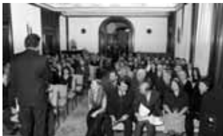
Předávání Křesadel 2004 se zúčastnilo 140 lidí.