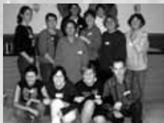
Dvougenerační dobrovolný tým