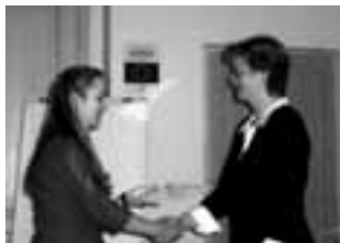
Předávání certifikátů účastníkům projektu

Projekt měl dobré výsledky zejména v tom, že pomohl k profesionálnímu růstu NNO a posílil komunikační dovednosti účastníků směrem ke komerčnímu sektoru a samosprávě. V neposlední řadě posloužil k výměně rad a informací mezi samotnými účastníky projektu.