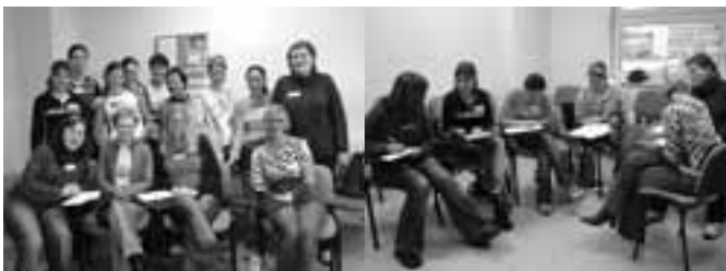
Parta připravená do Masarykovy nemocnice

Každý rok dobrovolníci přicházejí, ale i odcházejí. V roce 2004 jich bylo 18. Byla to dobrá zkušenost pro všechny, kdo mají rádi lidi, komunikaci a jsou ochotni někomu pomoci. Odměnou dobrovolníkům byl dobrý pocit, nová přátelství a zajímavá zkušenost.