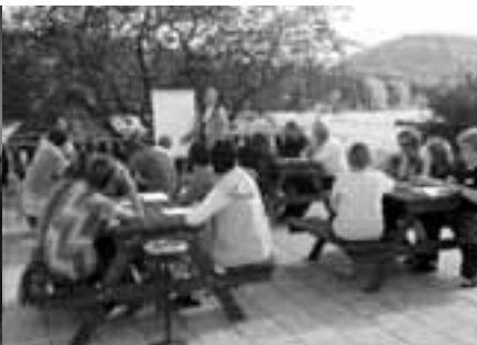
Maxov u Sloupu v Čechách - říjen 2004