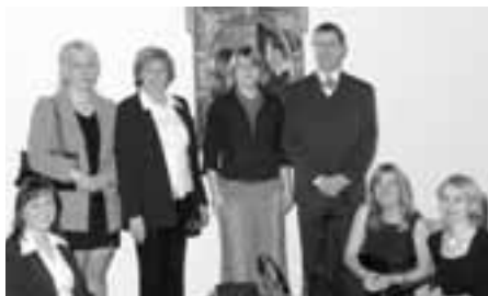
Vybraní dobrovolníci za rok 2004

Cenu Křesadlo předávají lidé z komerční i státní správy. Lidé, kteří dobrovolnictví fandí.