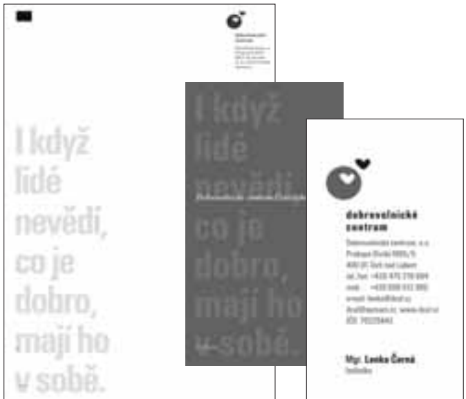
ukázka dopisního papíru a vizitky

I když lidé nevědí, co je dobro, mají ho v sobě.