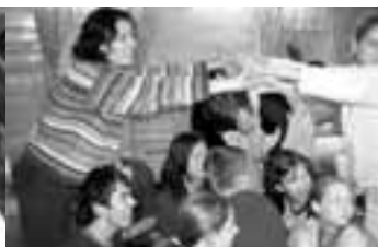
Klub Dobroš 9. října - líčení sama sebe - kurz batikování Víkendový výcvik dobrovolníků z gymnázií v Děčíně a Teplících - 5.- 7.11.

Program Rozvoj občanských ctností středoškoláků byl uskutečněn s podporou Evropského společenství. Obsah tohoto projektu nemusí vyjadřovat stanovisko Evropského společenství či Národní agentury ani nezakládá odpovědnost z jejich strany (Agentura Mládež), projekt byl dále podpořen v rámci dotačního programu Ústeckého kraje.