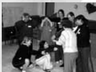
Výcvik dobrovolníků v Žandově