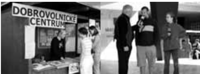
Veletrh sociálních služeb ve městě Ústí nad Labem