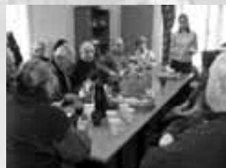
1. setkání o Radě seniorů