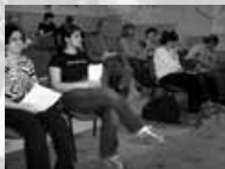
2. setkání o Radě seniorů