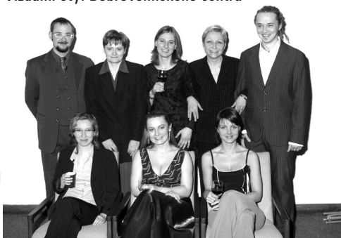
tým Dobrovolnického centra