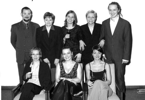
tým Dobrovolnického centra