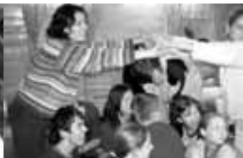
Klub Dobroš 9. října - líčení sama sebe - kurz batikování Víkendový výcvik dobrovolníků z gymnázií v Děčíně a Teplících - 5.- 7.11.

Program Rozvoj občanských čtností středoškoláků byl uskutečněn s podporou Evropského společenství. Obsah tohoto projektu nemusí vyjadřovat stanovisko Evropského společenství či Národní agentury ani nezakládá odpovědnost z jejich strany (Agentura Mládež), projekt byl dále podpořen v rámci dotačního programu Ústeckého kraje.