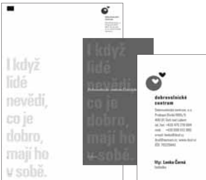
ukázka dopisního papíru a vizitky

I když lidé nevědí, co je dobro, mají ho v sobě.